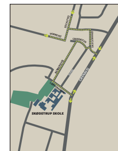
Sikker afsætning på Lærkebakken